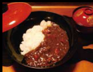
大榎華麗 カレー 850円